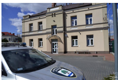
Siedziba Straży Miejskiej

Adres źródłowy: https://www.konstancinjeziorna.dev01.vobacom.info/page/straz-miejska-1